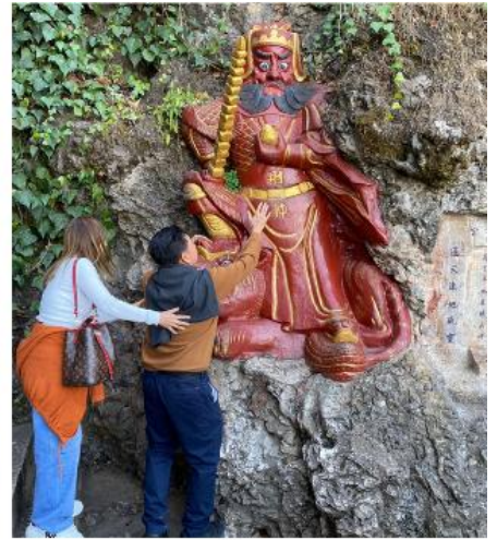
เทพเจ้ากวนอู