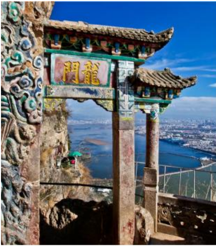
ประตูมังกร

เทพกวนอู นอกจากเป็นเทพเจ้าแห่งความซื่อสัตย์แล้ว คนจีนยังเชื่อว่ากวนอูเป็นเทพเจ้าแห่งโชคลาภและความร่ำรวย โดยให้ไหว้อิฐฐาน จากนั้นแล้วลูบก้อนทองในมือกวนอู แล้วจึงล้วงมือเข้าไปในปากปีเซี่ยะ 3 ครั้งกำมือแล้วนำเข้ามาใส่กระเป๋าพร้อมมรดกชีพ