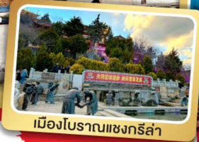
เมืองโบราณแซงกรี่ล่า