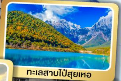
ทะเลสาบไปสุยเหอ