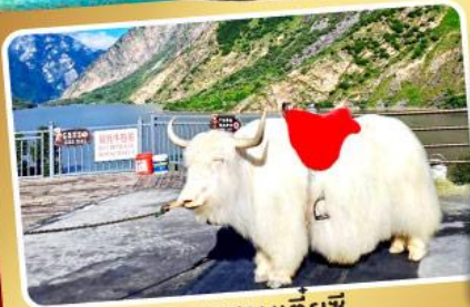
ทะเลสาบเตี้ยซี