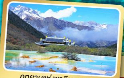
อุทยานแห่งชาติหวงหลง