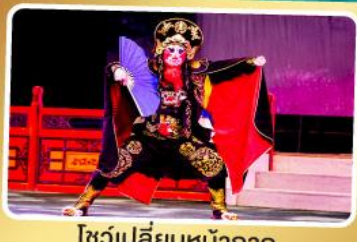
โชว์เปลี่ยนหน้ากาก