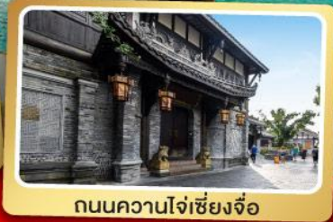
ถนนความใจเซียงจื่อ