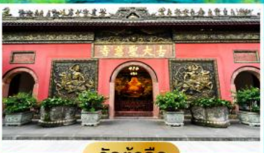
วัดต้าอ้อ