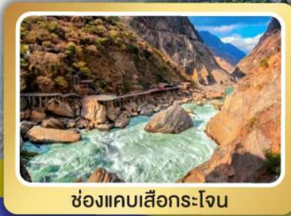
ช่องแคบเสื่อกระโจน