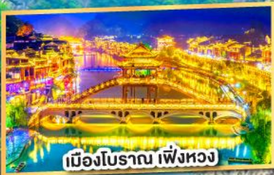
เมืองโบราณ เฟิ่งหวง