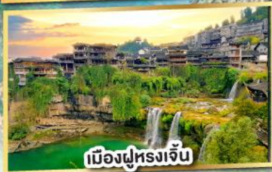
เมืองฝูหลงเจิน