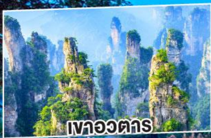
หวอจวนตาร