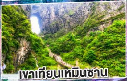
เวาเทียนเหมินซาน